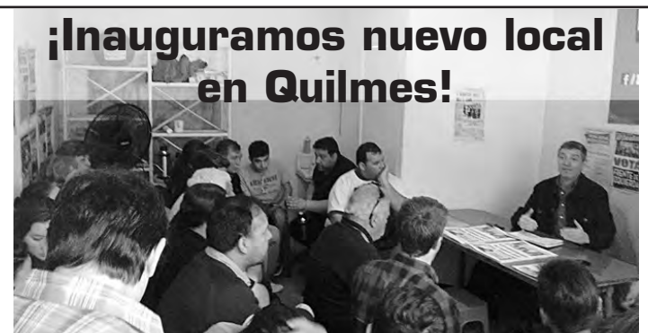
¡Inauguramos nuevo local en Quilmes!

En una facultad financiada y dirigida por los defensores del ajuste de Macri, tomamos la tarea de impulsar la formación y organización de la juventud para enfrentar dicho ajuste y fortalecer al Frente de Izquierda. Por ello, la cátedra también está puesta al servicio de la difusión y la convocatoria al acto de Atlanta del 19 de noviembre.