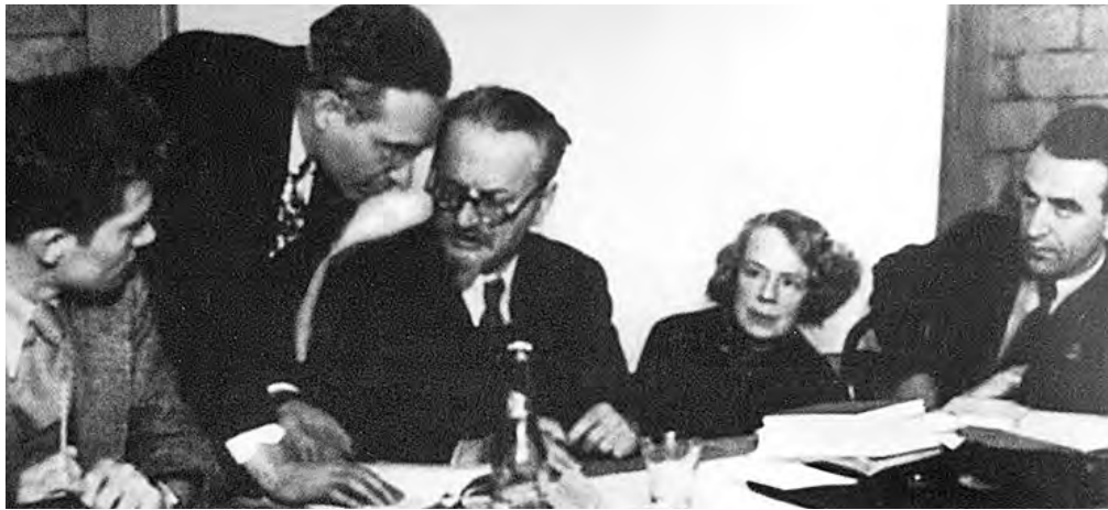
Trotsky ante miembros de la “Comisión Dewey” en Coyoacán. A su izquierda, su compañera Natalia Sedova.

La dictadura de Stalin fue imponiendo su dominio persiguiendo a los opositores, en primer lugar dentro del partido y especialmente a los trotskistas. Para 1928 habían sido expulsados y arrestados decenas de miles de auténticos bolcheviques. La colectivización forzada de los campos costó la vida —por el hambre, el frío, las epidemias y la represión— de millones de campesinos. Pueblos enteros fueron trasladados arbitrariamente para “poblar” las zonas más lejanas e inhóspitas del vasto territorio soviético. El aumento de la producción en las fábricas (conocido