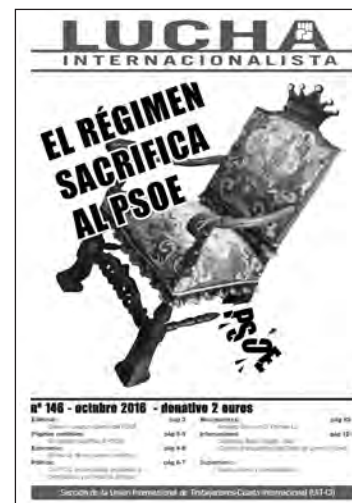
Tapa del periódico de Lucha Internacionalista, sección de la UIT-CI en el Estado español.

Como sucedió con el Pasok de Grecia que se derrumbó y en menor escala con otros partidos de la socialdemocracia europea, la crisis del PSOE es muy profunda y sin salida. La socialdemocracia ya no puede ofrecer mejoras parciales a los trabajadores y casi no se diferencia de los partidos de la llamada derecha neoliberal. Con eso