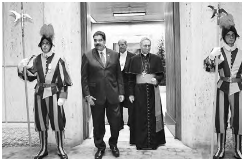
Maduro se reunió con el Papa. La iglesia mediará entre el gobierno y la MUD

El revocatorio sólo apunta a sustituir el gobierno de Maduro por otro