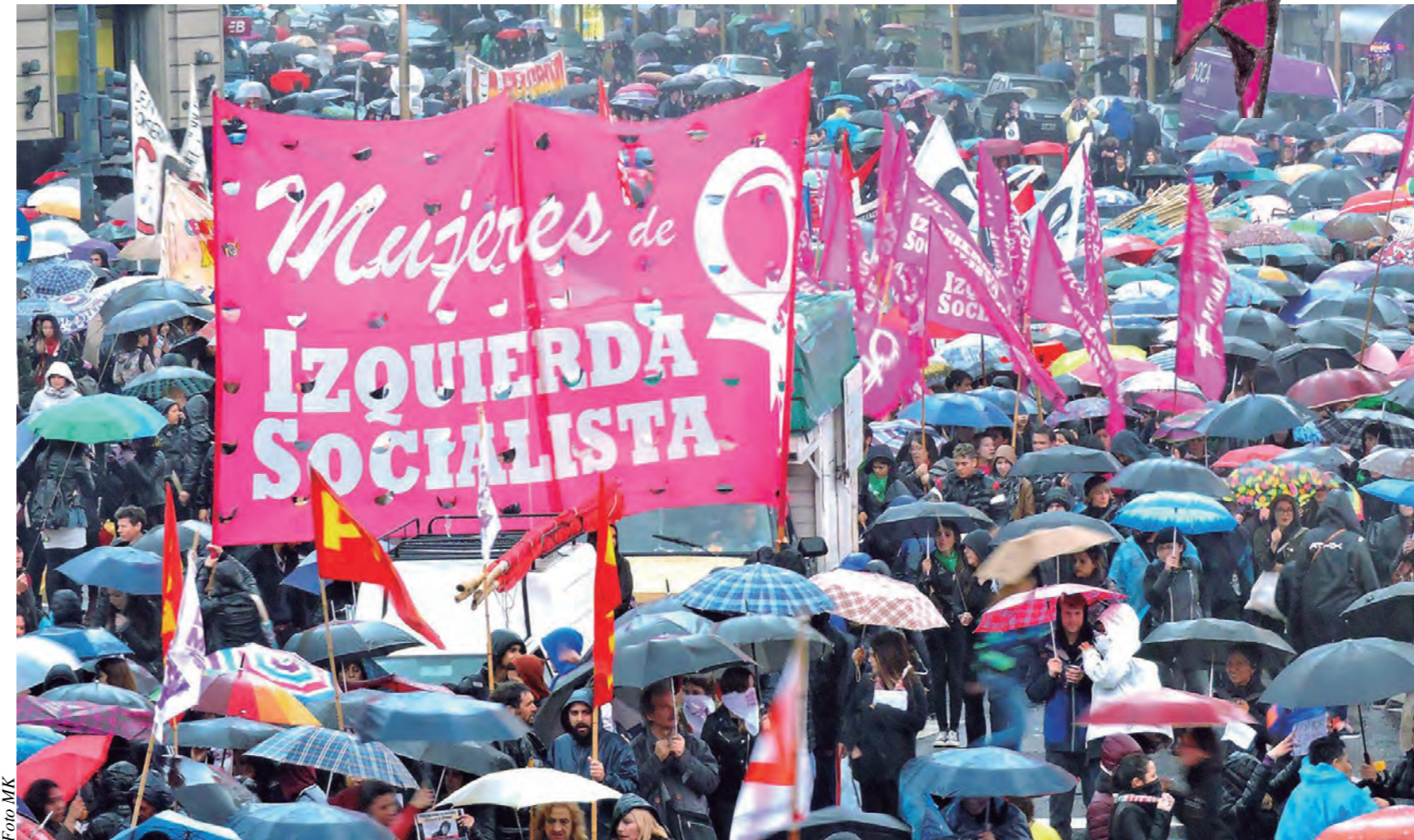
Mujeres de Izquierda Socialista en la multitudinaria marcha del miércoles 19

Por eso es que a pesar de la lluvia torrencial, y como lo vimos por