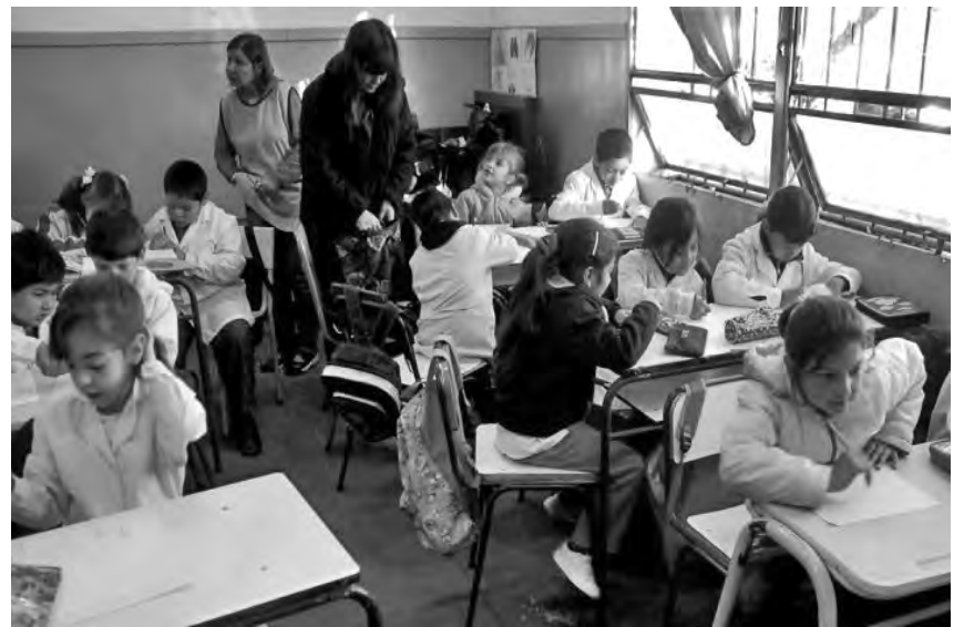
Los docentes evaluamos permanentemente a nuestros alumnos

El gobierno dice que “no piensan hacer rankings de escuelas, ni darle menos presupuestos a las que les va peor, ni pagar diferenciadamente a los docentes (según cuántos alumnos aprueben), sino que sólo quieren saber en qué estado está el sistema educativo, aunque ya sabemos que los resultados serán malos”. Lo que tratan de ocultar es que estas evaluaciones como el Operativo Aprender no son un invento de Macri y Bullrich, sino que son pruebas internacionales, armadas por empresas como Techint. ¿Para qué las utilizan en todos los países? Para hacer ranking, cerrar