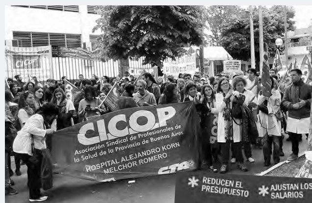
Marcha de los profesionales de la salud

Los profesionales de la salud bonaerenses continúan su plan de lucha con paros escalonados y movilizaciones. Esta semana serán tres jornadas de huelga los días martes, miércoles y jueves en conjunto con becarios y residentes.