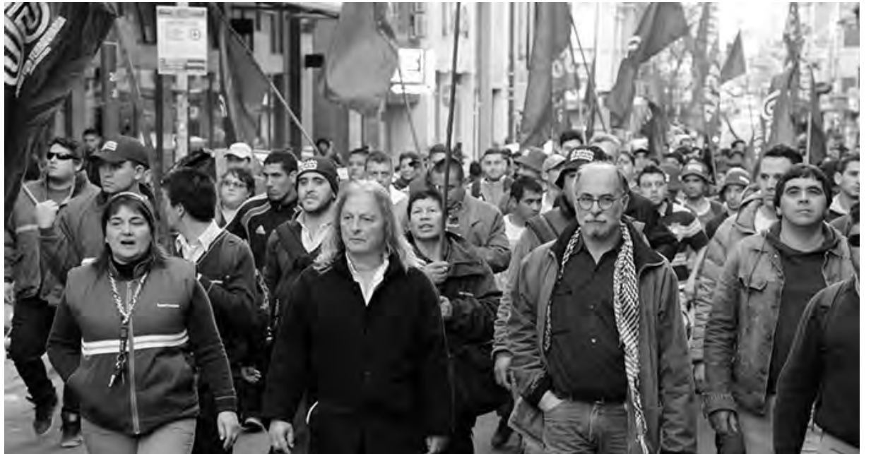
Marcha de los ferroviarios del Sarmiento en defensa de sus conquistas

El 9 de noviembre se realizarán elecciones para elegir cuerpo de delegados en la mayoría de los ferrocarriles. La Bordó se presenta para enfrentar a la burocracia de la Verde en los ferrocarriles Belgrano Norte, Mitre, NCA y Sarmiento, en este último para retener su combativo cuerpo de delegados. No habrá elecciones en el Roca, pero referentes de la Bordó ya abogan por una lista de unidad para cuando las convoquen. La Verde no puso fecha a las elecciones de ejecutiva seccional y nacional.